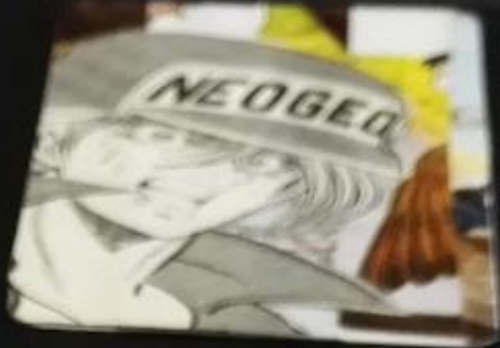
What is cardboard used for?